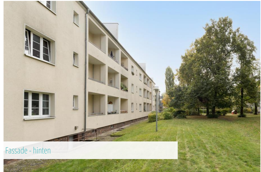
Fassade - hinten